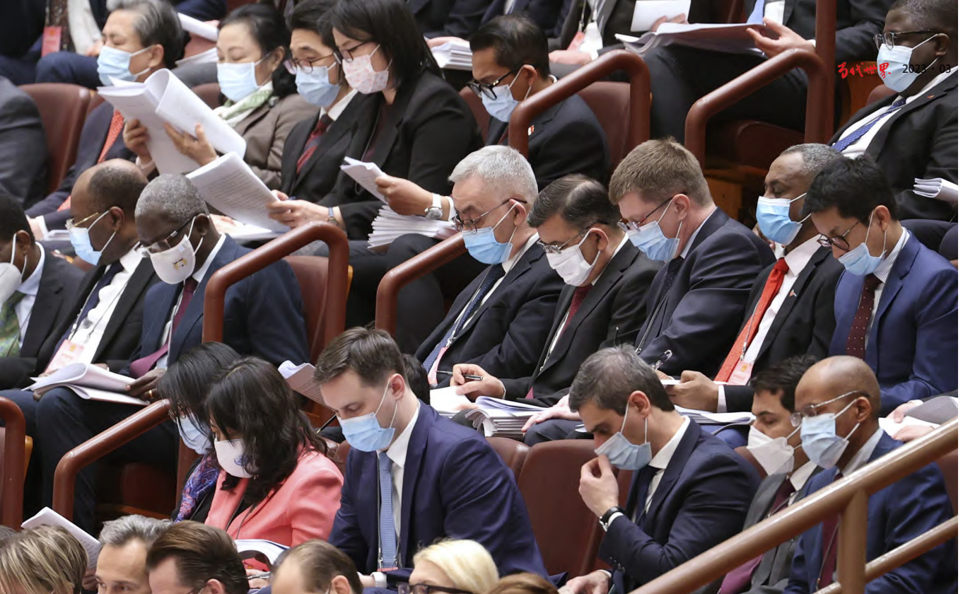
2022年3月5日，第十三届全国人民代表大会第五次会议在北京人民大会堂开幕。图为外国驻华使节旁听大会。

代特点和国情特色的具体要求。全链条、全方位、全覆盖的中国特色的全过程人民民主建设，进入了又一个新发展阶段。“健全人民当家作主制度体系，扩大人民有序政治参与，保证人民依法实行民主选举、民主协商、民主决策、民主管理、民主监督，发挥人民群众积极性、主动性、创造性，巩固和发展生动活泼、安定团结的政治局面”进一步形成和巩固。